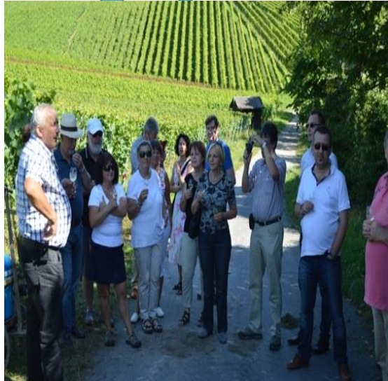
Scheuet nicht den Weg zum Ziehtöchterlein